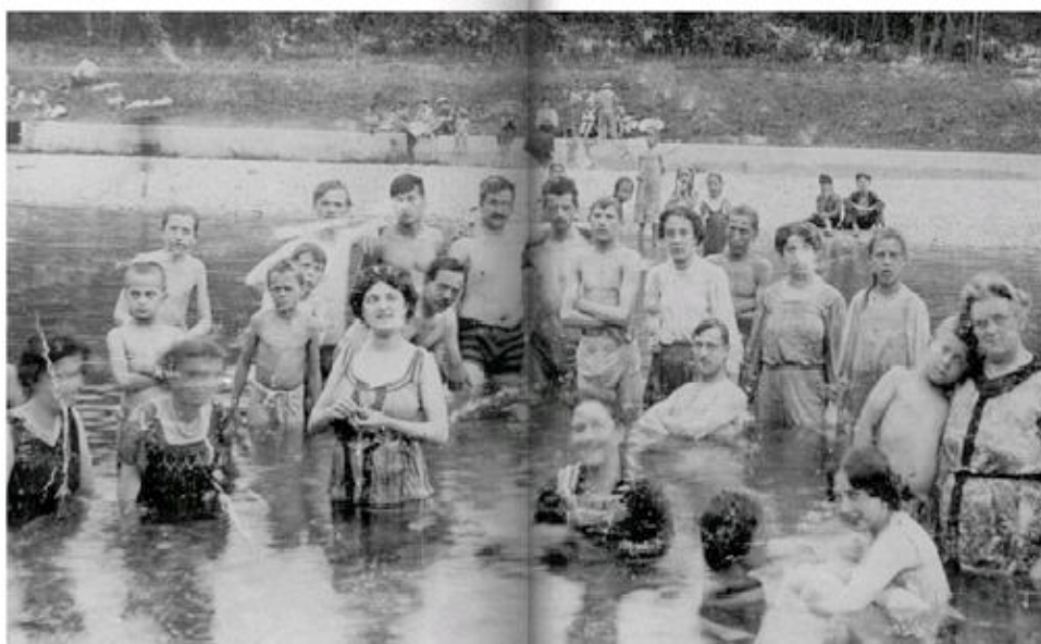
Burkinis? Mitnichten: Es ist St. Pöltner Bademode anno 1913.