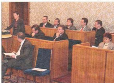
Gedrückte Stimmung im Stadtparlament: Die SPÖ-Fraktion (Bild) steht hinter den Sparplänen des Bürgermeisters, die Oppositionsparteien üben massive Kritik.

HORRORDEFIZIT / Finanzlücke betrug ursprünglich 14 Millionen.